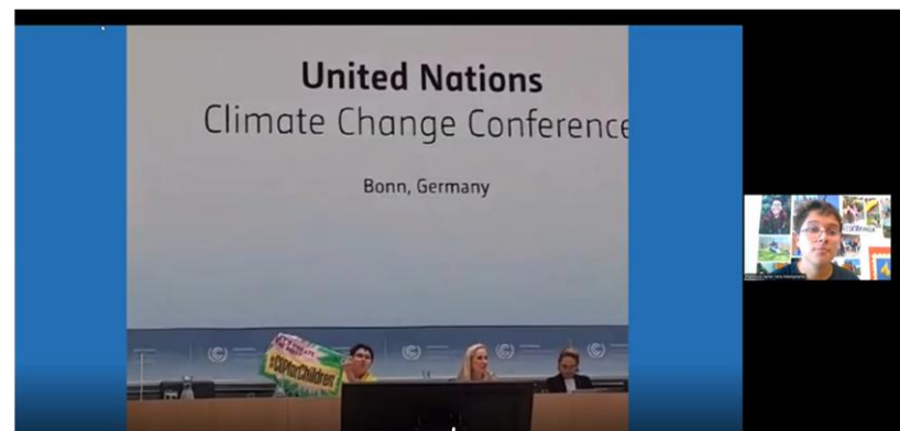
ユニセフの若者気候変動アドボケイトとして 国連の気候変動カンファレンスに参加した話