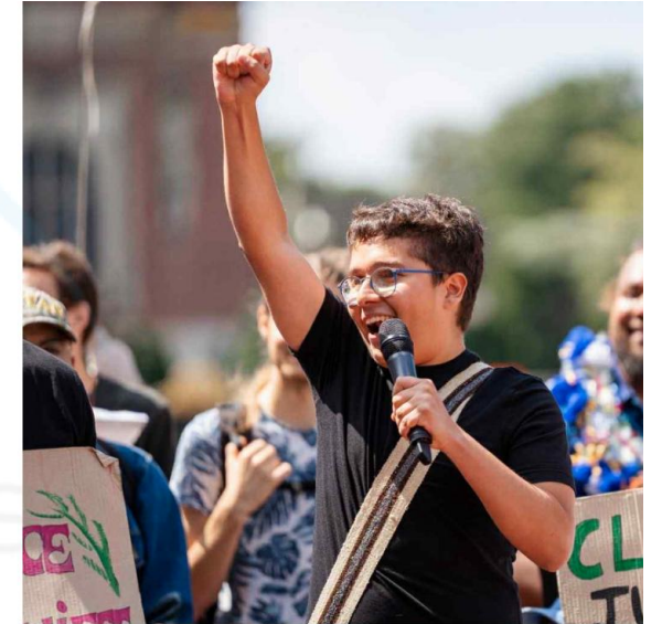
初年度は15歳のコロンビア出身 環境活動家のフランシスコ・ベラ