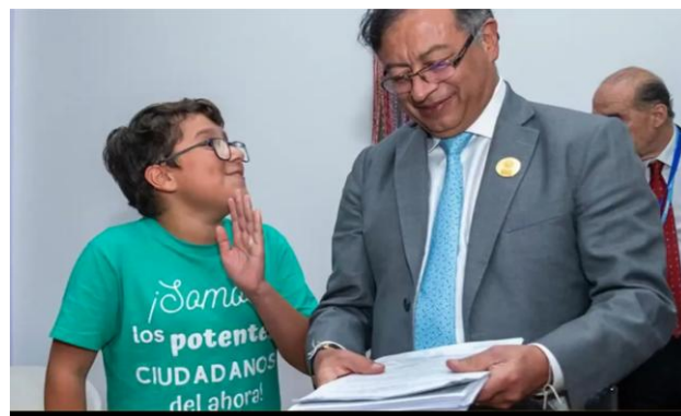
コロンビア大統領に署名を渡す